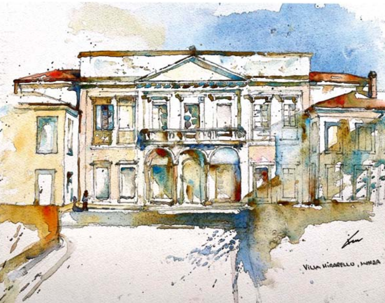
Acquerello di Kim Sommerschild - www.kimsommerschild.com

Un Paese che legge è una storia bellissima